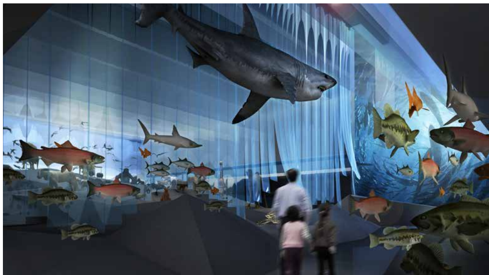
Impressie van De Ontmoeting. Beeld: Atelier Brückner.

De nieuwe inrichting van Naturalis is 'the best of three worlds' : een combinatie van museum, science center en experience. Het is een aanpak die op deze schaal nog niet eerder in Nederland en Europa is vertoond. In een museum ligt de nadruk op zien , in een science center op doen en in een experience op ervaren . Met de combinatie tussen deze drie sluit Naturalis naadloos aan op verwachtingen, behoeften en interesses van families. Je wordt ondergedompeld in een totaalervaring die je even helemaal wegvoert van het hier en nu. Door een mix van deze drie aan te bieden creëert Naturalis een spannende bezoekerservaring, met voor elk wat wils. Steeds wordt het middel gekozen dat het verhaal het meest krachtig vertelt. De Ontmoeting maakt vooral gebruik van veel echte collectie, aangevuld met theatrale effecten om de bezoeker deel te laten uitmaken van de natuur in al zijn pracht. Hier kom je de meest uiteenlopende kleuren, geuren, geluiden en vormen van onze levende planeet tegen.